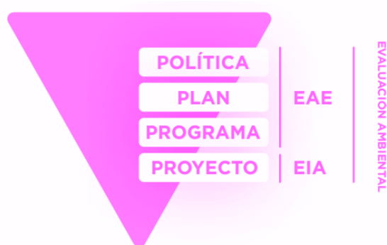
Figura 1 - Jerarquía de las evaluaciones ambientales